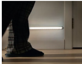
Le chemin lumineux pour les déplacements nocturnes