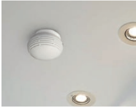
Le détecteur de fumée

Le Département propose d'autres objets domotiques raccordés à son réseau de téléalarme adaptés à différents handicaps ou associés à d'autres périphériques pour aménager le logement.