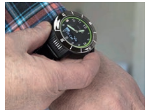
Dispositif de géolocalisation