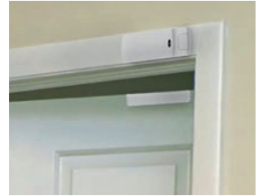
Le détecteur d'ouverture de porte